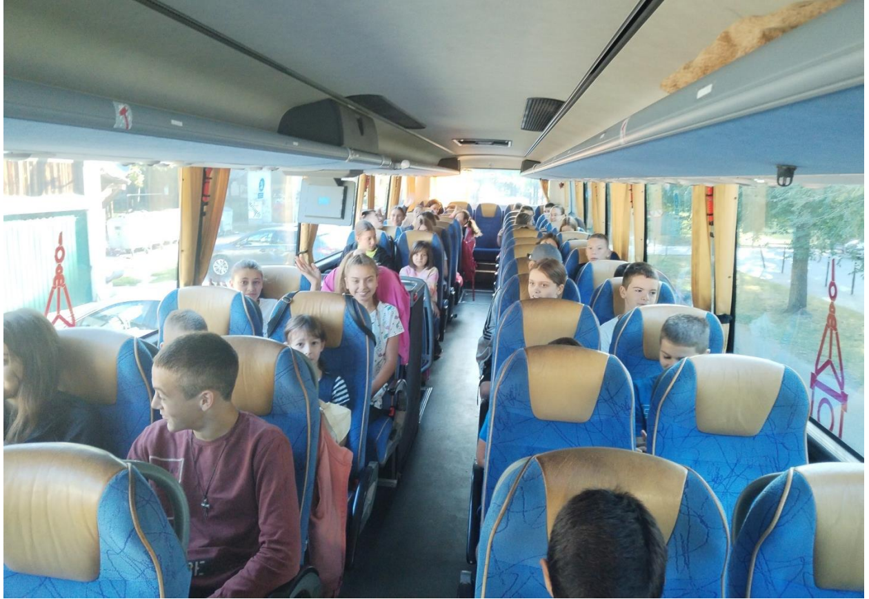
- Сумирање утисака на путу до Меленаца