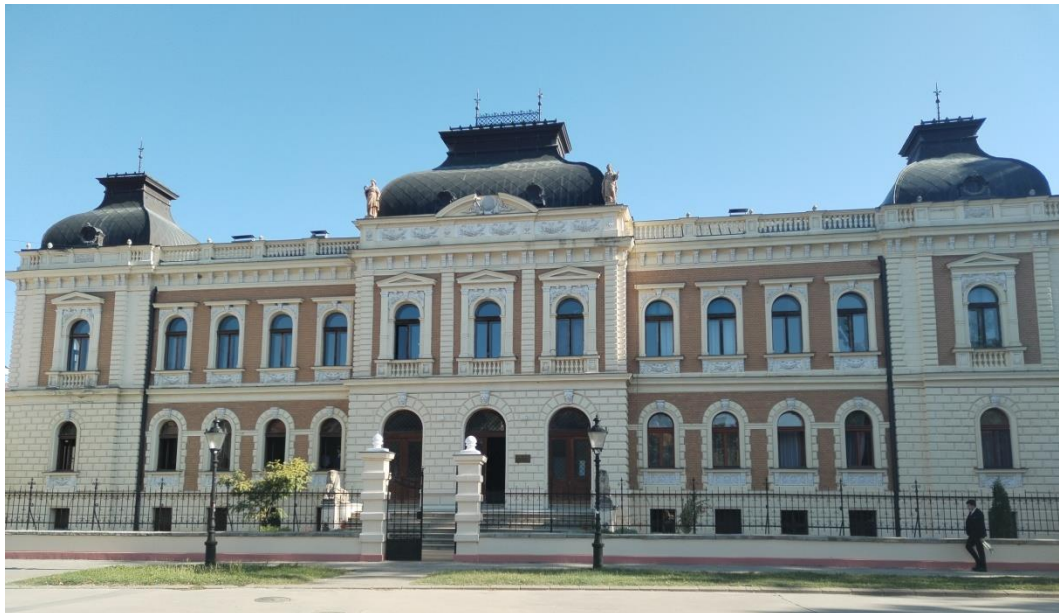
Карловачка богословија (средња богословска школа)