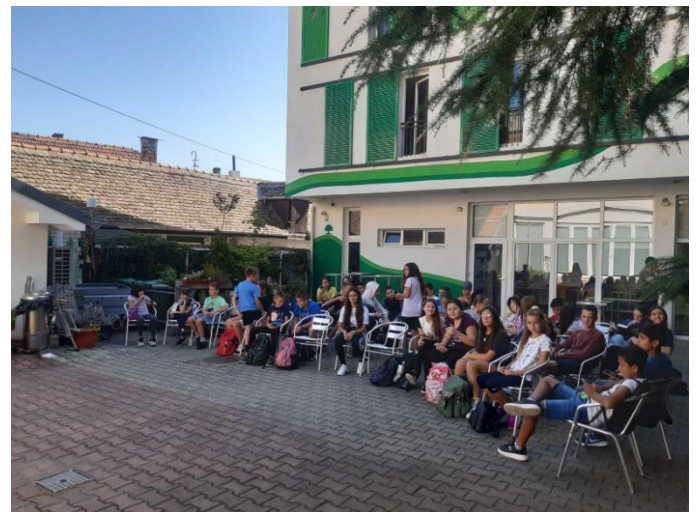
Еколошки центар Покрета горана „Радуловачки“