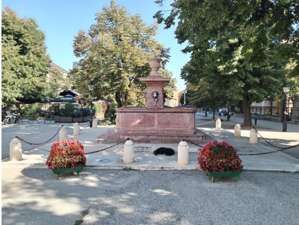
Чесма „Четири лава“

- Након тога је била планирана посета еколошком центру „Радуловачки“ који се бави заштитом животне средине и организацији кампа за волонтере из наше земље и иностранства