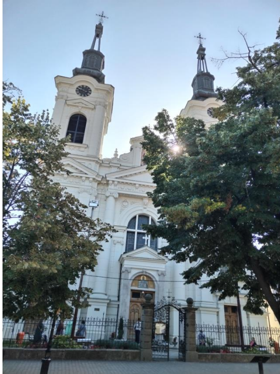
Саборна црква посвећена Светом оцу Николају